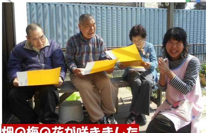
畑の梅の花が咲きました