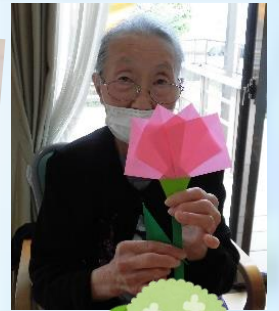
「私、お花がだ〜い好きなの♡」