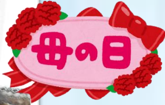
「うまくできたよー」