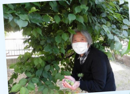
「上の方にまだたくさんあるよ」