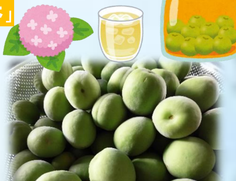
梅仕事、ありがとうございました