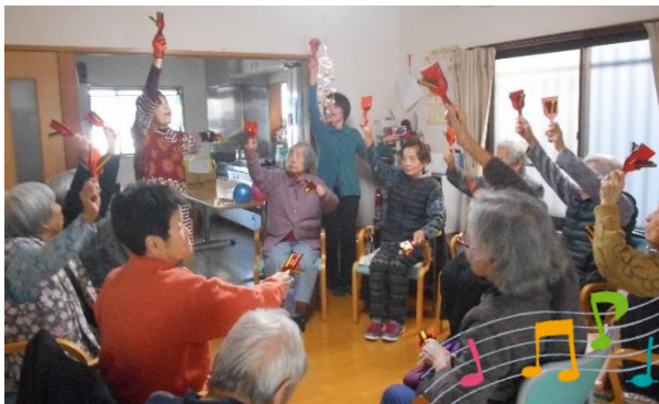
ミュージックケアの先生が来てくれました！