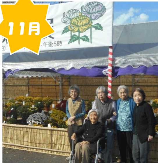
阿久比町の菊花展に行きました