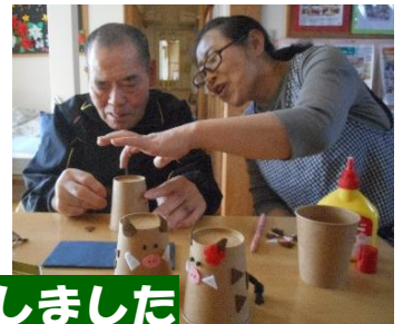
来年の干支の工作をしました