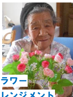
フラワー アレンジメント