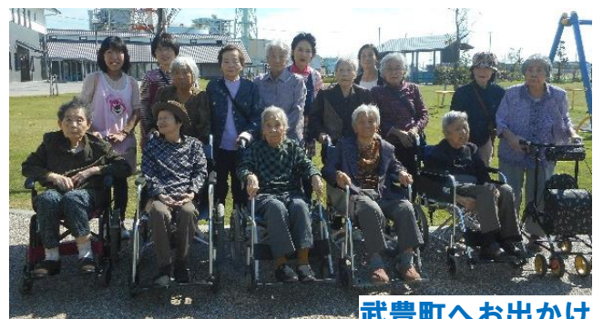
武豊町へお出かけ