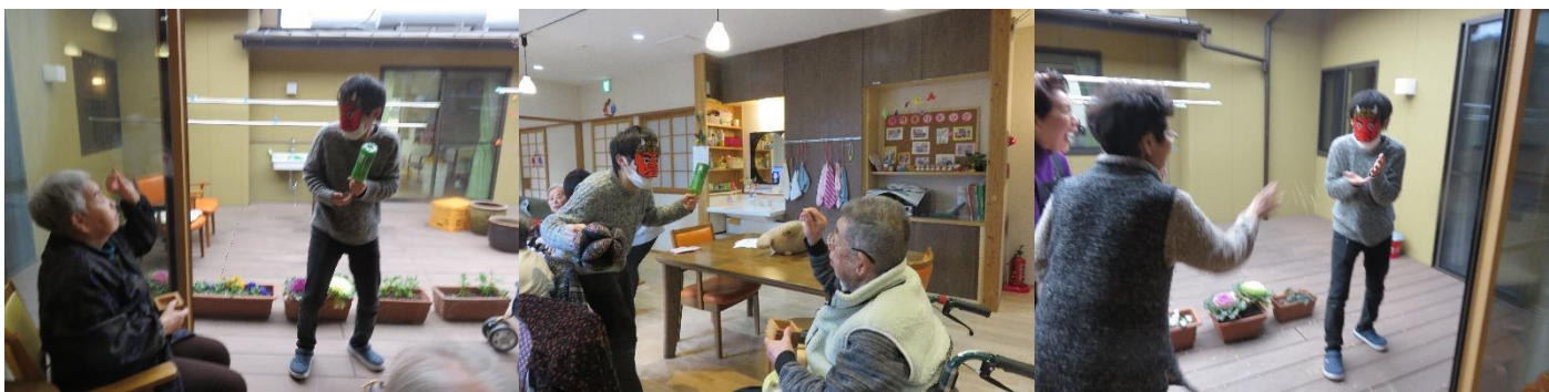
鬼が来た！ あまり強そうじゃないけど鬼は鬼！！