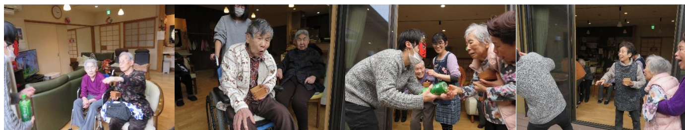
本気でまく人、食べる人…