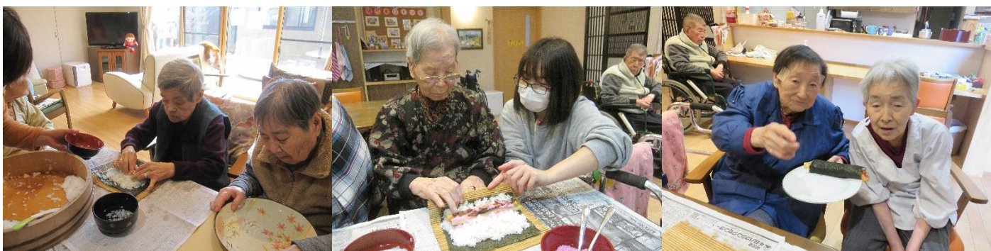
お昼ご飯は恵方巻ですよ。いっぱい作って！いっぱい食べました！