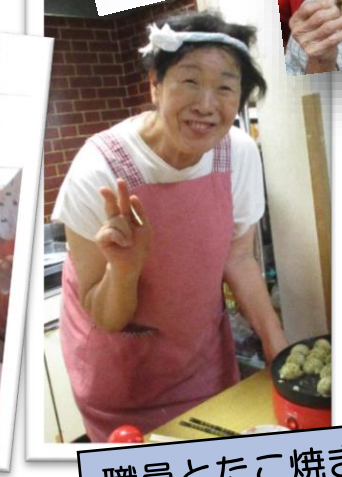
職員とたこ焼き作り！楽しいね