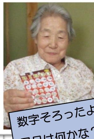
数字そろったよ 景品は何かな？