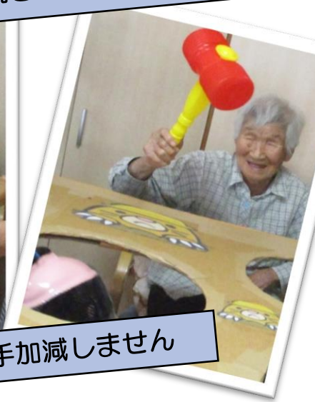
笑って笑ってのもぐらたたき！手加減しません